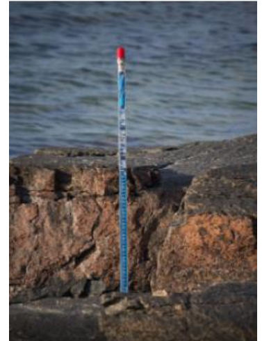
Model : SM4