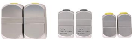
Transducer (L & M & S)